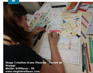
Stage Création d'une Planche - Carnet de Voyage Atelier V. Wibaux - 59 www.virginiewibaux.com

Vous désirez connaître le programme culturel en Pévèle Carembault et recevoir Quels Talents ! par mail ?